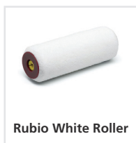
Rubio White Roller