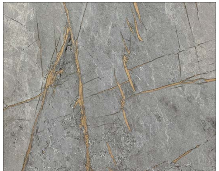
DM LIMESTONE Grey Nature SA