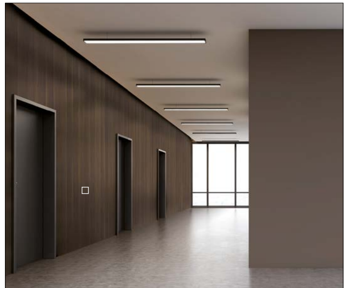
□ WL Nutwood Nature