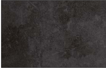
DM CEMENT Dark Nature SA 2600 x 1000 / SA 25515