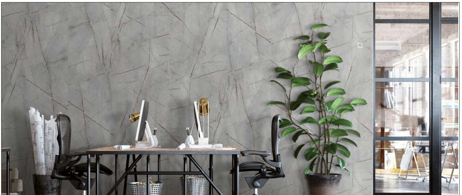
□ DM LIMESTONE Grey Nature

The mark of responsible forestry FSC® C172111