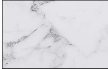
DM MARBLE White Nature SA 2600 x 1000 / SA 25545