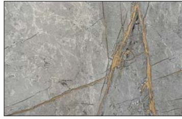
DM LIMESTONE Grey Nature SA 2600 x 1000 / SA 25894