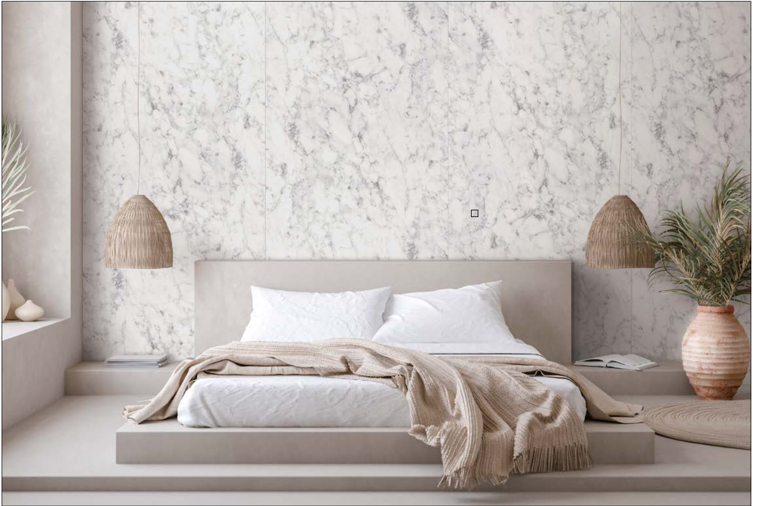
□ DM MARBLE White Nature