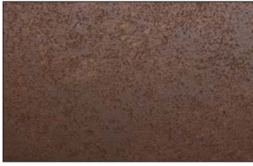
DM Corten Nature SA 2600 x 1000 / SA 25548