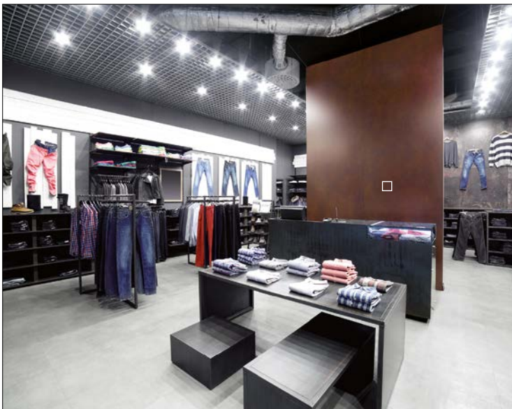
□ DM Corten Nature