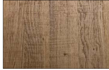
WL Sessile OAK Nature SA 2600 x 1000 / SA 25511