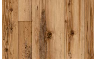
WL Sunwood Nature SA 2600 x 1000 / SA 25896