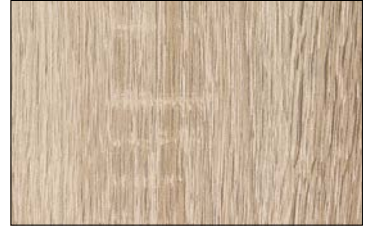
WL OAK TREE Light Nature SA 2600 x 1000 / SA 25544