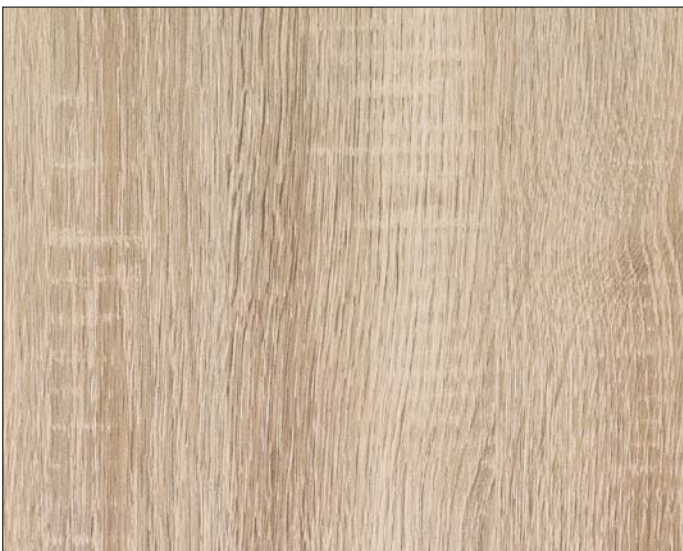
WL OAK TREE Light Nature SA