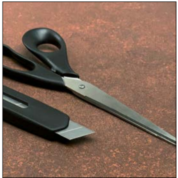
Bearbeitung: immer von der Dekoroberfläche. Processing: always from the patterned side.