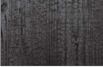
WL Carbonized Wood Nature SA 2600 x 1000 / SA 25549