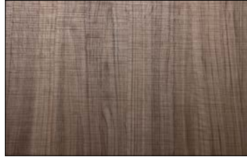
WL Nutwood Country Nature SA 2600 x 1000 / SA 25546