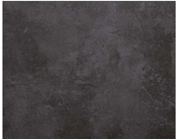
DM CEMENT Dark Nature SA