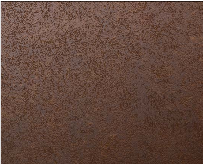
DM Corten Nature SA

With the sustainable and particularly light decorative panels of the NATURE-LINE large wall surfaces can be designed quickly and easily. The FSC®-certified and self-adhesive products can be glued to all substrates without expansion gaps.