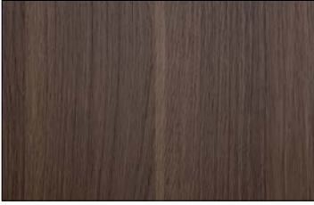
WL Nutwood Nature SA 2600 x 1000 / SA 25547