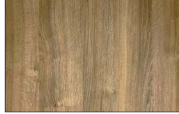
WL Willow OAK Nature SA 2600 x 1000 / SA 25895