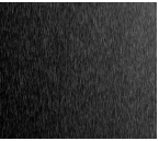
#717 Black Brushed Aluminum