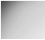
#719 Satin Silver Alum.