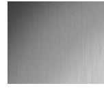
#720 Brushed Smoked Alum.