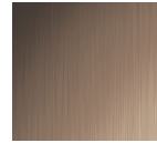
#721 Oiled Bronze Alum.