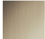
#724 Champagne Brushed Alum.